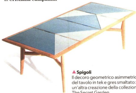
▲ Spigoli Il decoro geometrico asimmetrico del tavolo in tek e gres smaltato: un'altra creazione della collezione The Secret Garden

L a libertà, come condizione necessaria del lusso, uno stato in cui materiale e spirituale confluiscono. È questa la disposizione d'animo che si associa oggi alla ricchezza. È una libertà di agire nel tempo e nello spazio, una flessibilità nuova perché senza confini, anche nell'abitare, tra lavoro e tempo libero, spazio intimo e di relazione, interno ed esterno. È anche questo ciò che la pandemia ci ha lasciato in eredità, insieme a tanto altro. Questo seme, for-