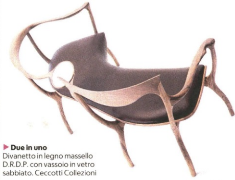
▶ Due in uno Divanetto in legno massello D.R.D.P. con vassoio in vetro sabbato. Ceccotti Collezioni