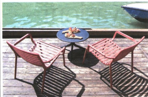
▲ Rosso marsala La collezione outdoor Doga di Raffaello Galiotto per Nardi, le poltroncine, in diverse tonalità, qui nella colorazione marsala