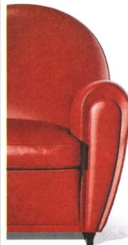
▲ Restyling La Vanity Fair XC, disegnata da Lazzeroni, propone un'evoluzione della celebre 904, o Vanity Fair, di Poltrona Frau

cento anni: se analizzi pezzo per pezzo la "madre" e la riedizione 2019 non trovi nulla di uguale, eppure, una accanto all'altra, sono chiaramente la stessa poltrona. E così è stato anche per la Vanity Fair, sono state riviste con precisione chirurgica le proporzioni, l'ergonomia per renderle adatte all'uomo di oggi». Insomma, ci vuole mano leggera e decisa. E una naturale familiarità col passato, che non guasta. «Sono da sempre legato ai segni di ieri, alla memoria, all'artigianalità», spiega Lazzeroni, «anche quando erano parole che non andavano proprio di moda, ma quasi tabù. Il mio interesse per la rivisitazione della casa borghese, per Pierre Chareau, per i decorateurs francesi, col loro gusto per materiali come palissandro, ebano, pelle galuchat, palma, pergamena? Era visto più come folklore che altro». Questa sensibilità, e cultura, invece permette a Lazzeroni di lavorare con brand diversi, rispettando e facendo emer-