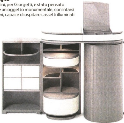
▼ Magico Houdini, per Giorgetti, è stato pensato come un oggetto monumentale, con intarsi esterni, capace di ospitare cassette illuminanti